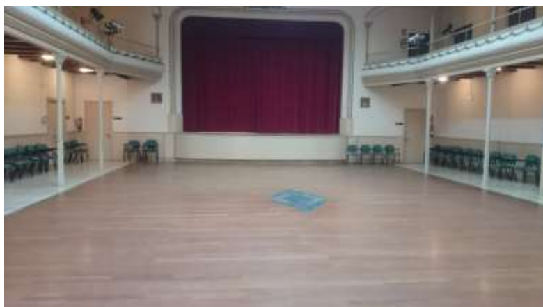
Foment Cultural i Artístic. Sala on es desenvoluparan les classes.