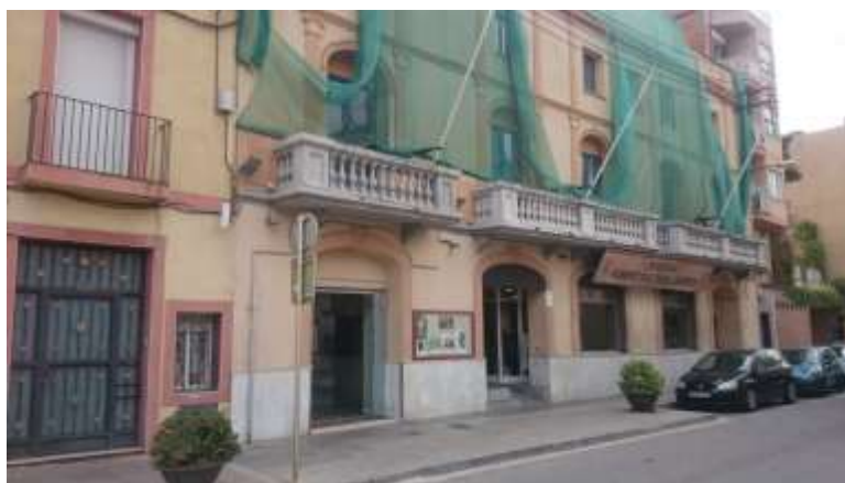
Façana Foment Cultural i Artístic (c/ Major, 54, Sant Joan Despí). Situat a 300 mts del Teatre.